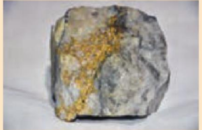
الف) کانی طلا