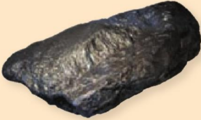
ب) کانی گرافیت

در شکل زیر دو کانی را مشاهده می کنید. درباره کاربرد هر یک از این کانی ها در زندگی گفت و گو کنید.