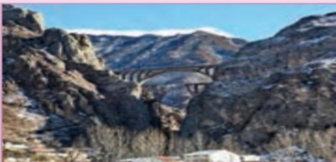
ب) کوه جوان

شکل زیر مربوط به دو کوه است. مقدار فرسایش آنها را با هم مقایسه کنید.