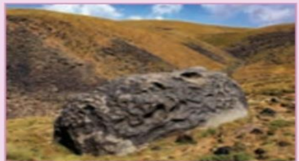
الف) کوه پیر